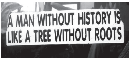
Afrikansk ordsprog – bilstreamer i Choma, Zambia.